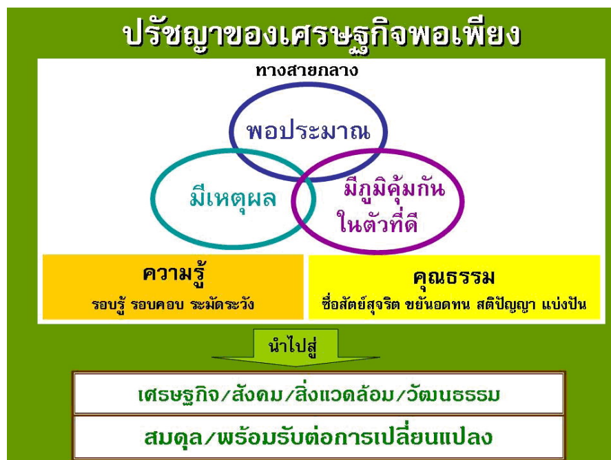
ภาพ 3 ปรัชญาของเศรษฐกิจพอเพียง

กล่าวโดยสรุป คือ เศรษฐกิจพอเพียง เป็นปรัชญาที่เป็นทั้งแนวคิด หลักการ และแนวทางปฏิบัติตนของแต่ละบุคคลและองค์กร โดยคำนึงถึงความพอประมาณกับศักยภาพของตนเอง และสภาวะแวดล้อมเพื่อให้สามารถพึ่งตนเองได้ โดยอาศัยความมีเหตุมีผล และการมีภูมิคุ้มกันที่ดีในตัวเอง โดยใช้ความรู้อย่างถูกหลักวิชาการด้วยความรอบคอบและระมัดระวัง ควบคู่ไปกับการมีคุณธรรม ซื่อสัตย์สุจริต ไม่เบียดเบียนกันแบ่งปันช่วยเหลือซึ่งกันและกัน และร่วมมือปรองดองกันในสังคม ซึ่งช่วยเสริมสร้างสายใยเชื่อมโยงคนในภาคส่วนต่างๆ ของสังคมเข้าด้วยกัน สร้างสรรค์พลังในทางบวกนำไปสู่ความสามัคคี การพัฒนาที่สมดุลและยั่งยืน พร้อมรับต่อการเปลี่ยนแปลงภายใต้กระแสโลกาภิวัตน์ได้ โดยสรุปได้ดังแผนภาพต่อไปนี้